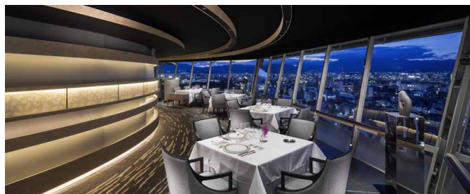
フレンチダイニング トップ オブ キョウト

※席数/個室・カウンター含む 営業時間帯/BF:朝食 L:ランチ D:ディナー FULL:フルタイム ※営業・空席状況は各店舗へお問い合わせください。