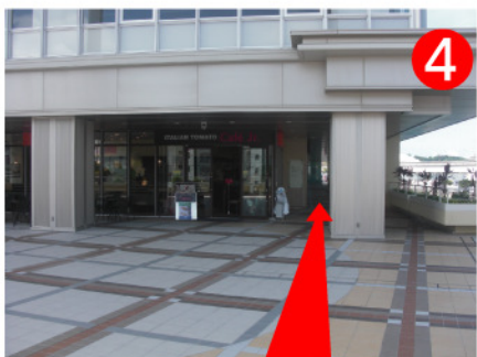
右手に川を見ながら、更に進むとホテルのサインが見えてきます。