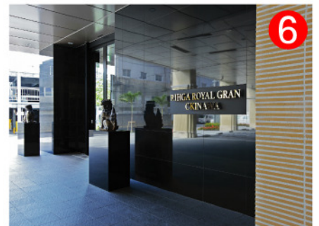
正面玄関ではシーサーがお出迎え。