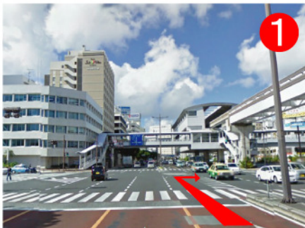
旭橋交差点を右折します。