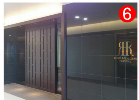
木製トビラを入れて2Fエントランスよりエレベーターをご利用ください。レストランおよびフロントは14階にございます。