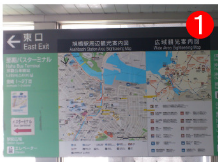
改札を出て東口（バスターミナル）方面へ。