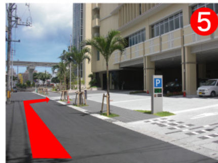
リーガロイヤルグラン沖縄の建物が見えたら入り口は目の前です。