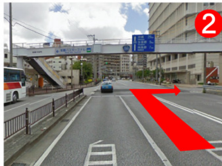
バスターミナルを左手に見ながら直進、陸橋を越えて最初の信号を右折します。