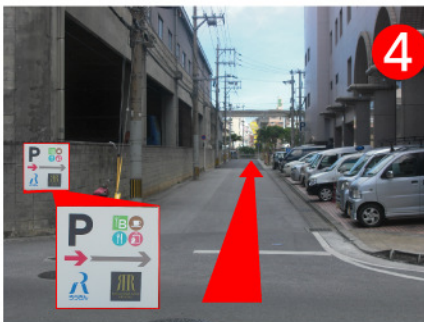
看板を目印に右折して突き当りまで進みます。