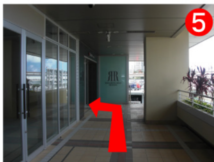
突きあたりのサインを左に曲がると2階入り口です。